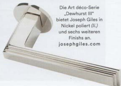
Die Art déco-Serie „Dewhurst III“ bietet Joseph Giles in Nickel poliert (li.) und sechs weiteren Finishes an. josephgiles.com