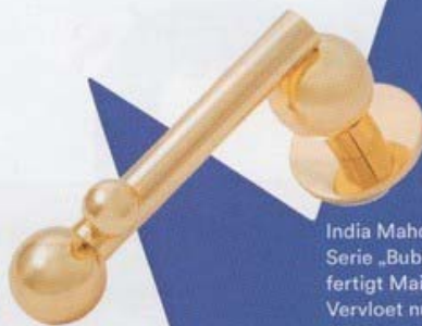
India Mahdavis Serie „Bubbles“ fertigt Maison Vervloet nur auf Anfrage. In poliertem Messing 172 Euro. vervloet.com

Ein schlichtes Türblatt ist ihre beste Bühne: schmucke Klinken und Griffe in extravaganten Materialien.