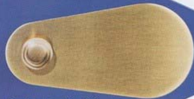
Rund und zackig: Griff aus gebürstetem Messing auf azurblau lackiertem Schild, beides für 420 Euro. bonnemazou-cambus.fr