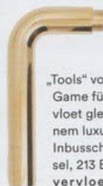
„Tools“ von Big Game für Vervloet gleicht einem luxuriösen Inbusschlüssel, 213 Euro. vervloet.com