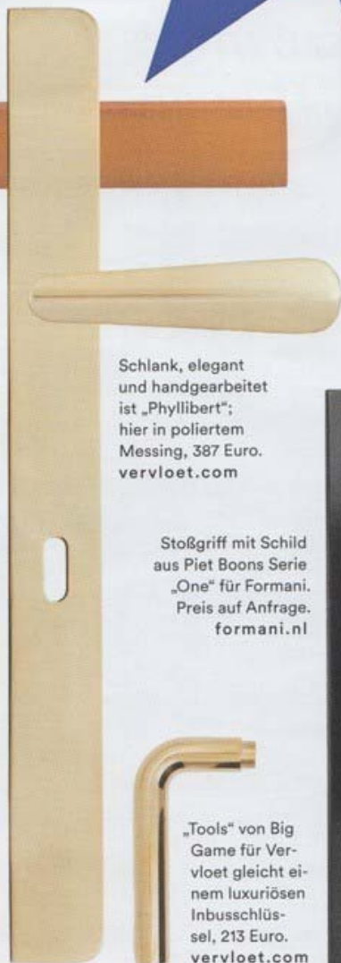
Stoßgriff mit Schild aus Piet Boons Serie „One“ für Formani. Preis auf Anfrage. formani.nl