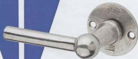
„Chemin de Fer“ fertigt Giara aus Naturbronze oder der Bronzelegierung Britannium (o.). Buntbartgarnitur, 150 Euro, über beschlaege.hamburg