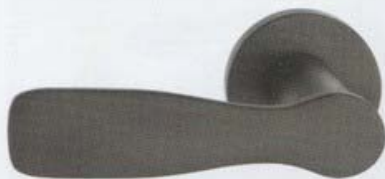
„FSB 1226“ entwickelte Studio Aisslinger fürs Berliner Hotel „25hours“, aus eloxiertem Aluminium, Preis auf Anfrage. fsb.de